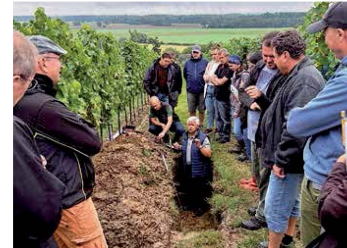
Účastníci polního dne Biocont projeví zájem o zdraví půdy

stavu pomocí revitalizace půdy, a to právě díky půdnímu kondicionéru Nutrigeo®L. Tento produkt je kapalný a lze jej aplikovat na jakoukoli půdu, jakoukoli plodinu, aby se zlepšila půdní mikrobiologie a zvýšilo se množství půdní houbové biomasy.